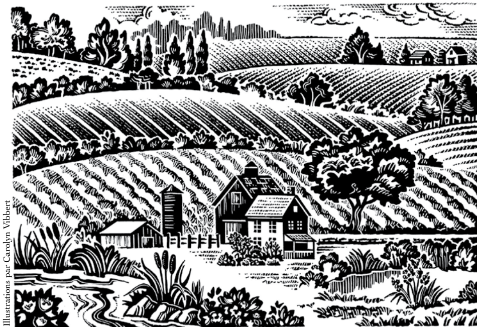
Illustrations par Carolyn Vibbert