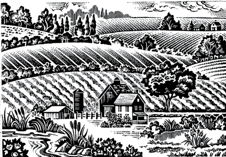
Illustrations par Carolyn Vibbert