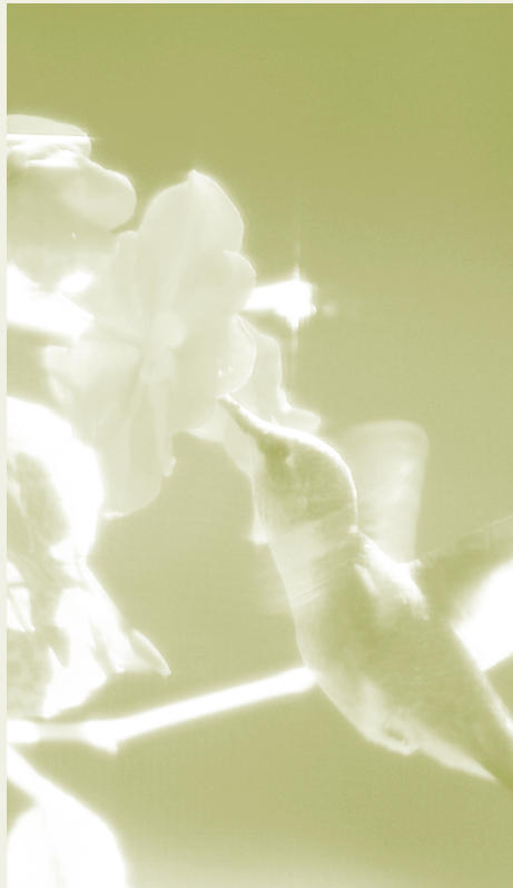
Le Colibri à gorge rubis, une espèce présente en été dans l'écorégion de Basses terres du Saint-Laurent.

Les papillons diurnes privilégient les aires ouvertes et ensoleillées, par exemple les prés et l'orée des bois où se trouvent des fleurs aux couleurs vives, des sources d'eau et des plantes hôtes spécifiques pour leurs chenilles. Depuis un bon moment déjà, les amateurs de jardinage leur « font la cour ». Pour attirer les papillons diurnes dans votre jardin, placez les plantes à fleurs en plein soleil, à l'abri du vent. Les fleurs qui offrent une bonne plateforme d'atterrissage leur plaisent particulièrement. Aménagez aussi des espaces ouverts (sol nu, grandes pierres), où les papillons