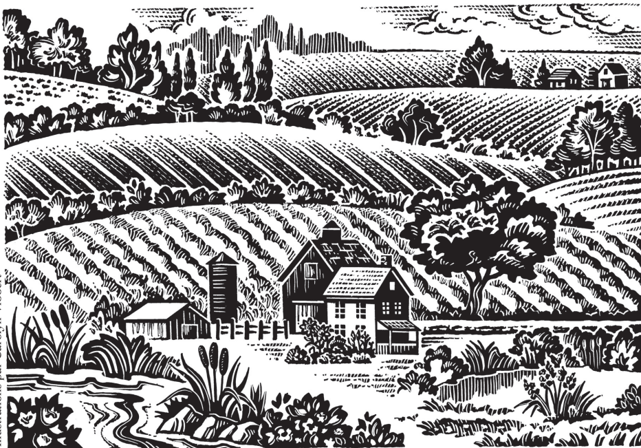
Illustrations par Carolyn Vibbert